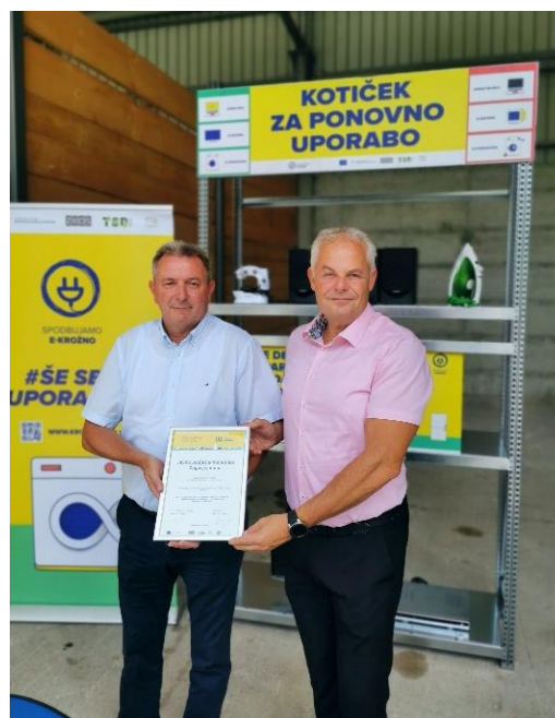
Slika: Oba direktorja s podpisno listino ob predaji kotička ponovne uporabe za EEO

Na Zbirnem centru Zagorje ob Savi je postavljen nov kotiček za vse, ki bi želeli oddati še delujoče aparate v ponovno uporabo. Kotiček najdete v zaprtem delu nadstrešnice Zbirnega centra in je označen z rumeno tablo ter tako nezgrešljiv. Tam lahko oddate še delujoče aparate, primerne za ponovno uporabo. V kotičku zbiramo vse vrste aparatov: velike aparate - pralne in pomivalne stroje, pečice, štedilnike, hladilnike, zamrzovalnike, orodje, male gospodinjske aparate, avdio-video in foto opremo, monitorje in televizorje z ravnim zaslonom, računalnike, mobilne telefone, igrače in ostale primerne aparate na elektriko ali baterije.